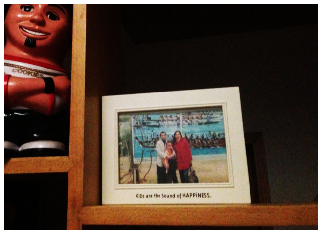
聪聪家壁上的全家福

植，是以中药和西药联合治疗的方式，如果治疗不成功，我们还可以选择接受骨髓移植手术，如果我在重庆就接受骨髓移植，一旦手术失败，我连选择的机会都没有了。”