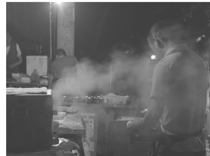
袁惠 周远芳/制图