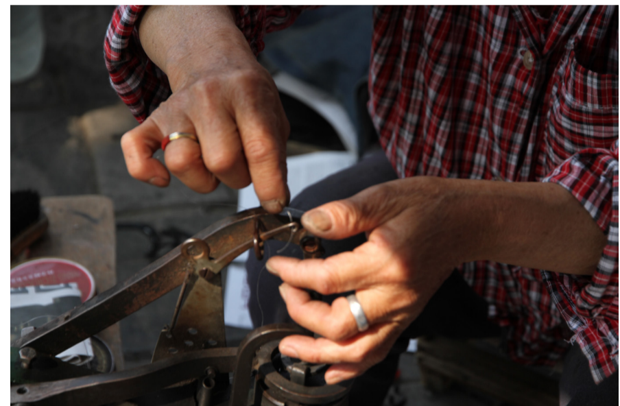
老人在补鞋