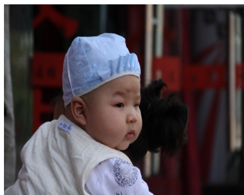
他三个月大，母乳喂养，微胖，正由婆婆背着去街上散步