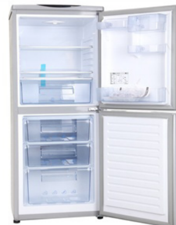
本栏目内容摘自重庆商报微博

地面油污: 在拖把上倒一点醋擦, 即可去掉地面油污。若水泥地面上的油污很难去除, 可在头天晚上弄点干草木灰, 用水调成糊状涂在地面上, 再用清水反复冲洗, 水泥地面便可焕然一新, 可减少洗涤剂和水的用量。