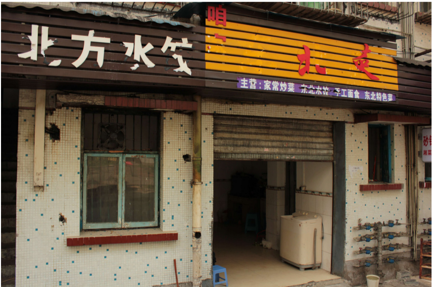
在许阿姨一家坚持之下搬迁的“咱家东北菜”

答：安装油烟净化器，油烟净化器体积小，便于安装，但油烟净化器存在先天缺陷：对于呛人的气味改善不大；净化器的运作会产生一定的噪音，也许会成为新的环保问题，最终还是需要环保局来管。☞