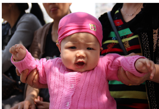
4个多月大的她依然是母乳喂养，不喜欢用奶瓶喝